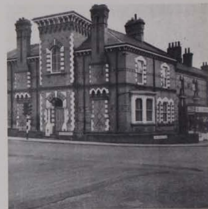
Eesti Maja Leicesteris.