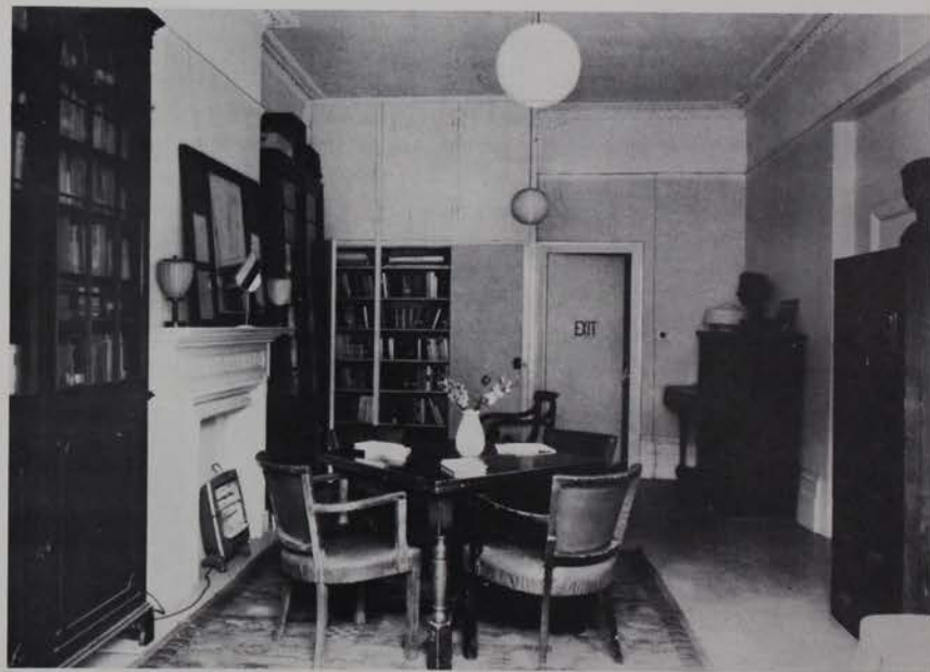
L.E. Seltsi Raamatukogu 1961 a.