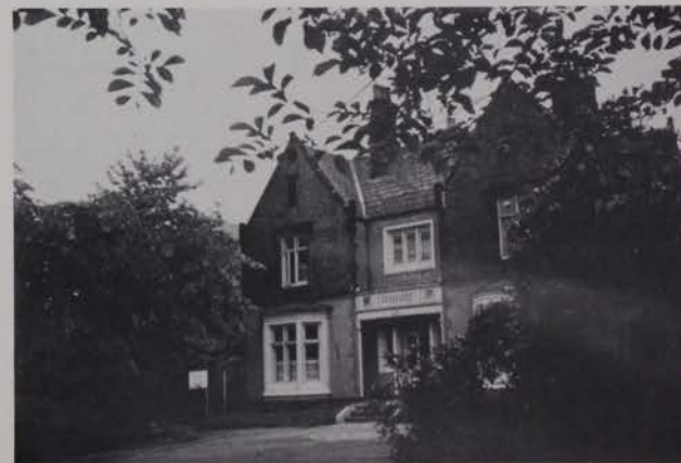
"Eesti Kodu" Bradfordis.