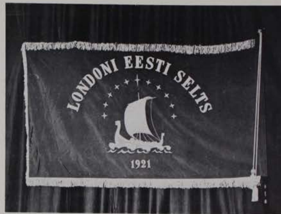
Londoni Eesti Seltsi lipp, mis valmistatud 1962 a.