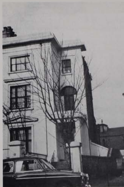
Eesti Maja Londonis.