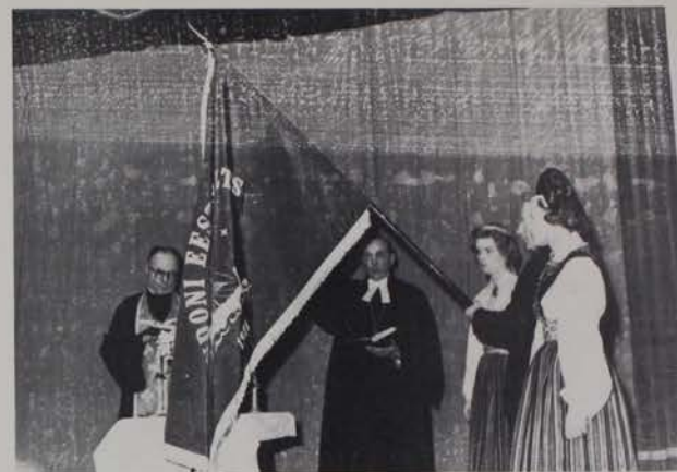
Londoni Eesti Seltsi lipu õnnistamine.